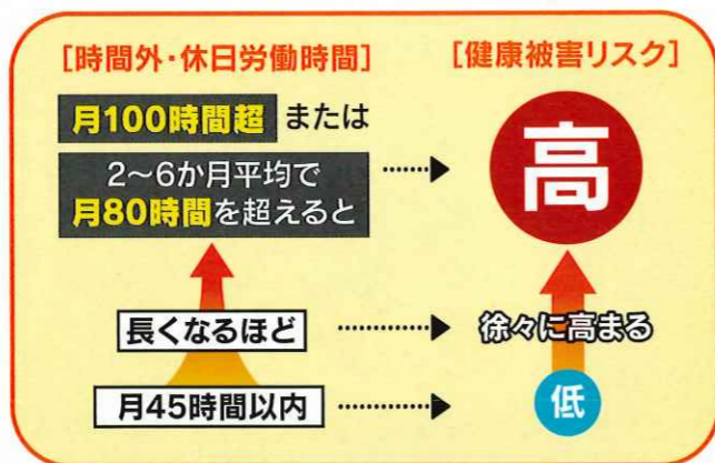
過重労働と健康リスクとの関連性

労働時間の現状をみると、週の労働時間が60時間以上の労働者の割合は近年低下傾向であるものの、労働者全体の5%以上となっており、いまだ長時間労働の実態がみられます。また、脳・心臓疾患が業務上によるものと認められた労災支給決定件数についても、依然として高い水準で推移しています。近年では、仕事上の強いストレスが原因となつてうつ病などの精神障害を発病し、それが労災と認められる件数も年々増加しています。